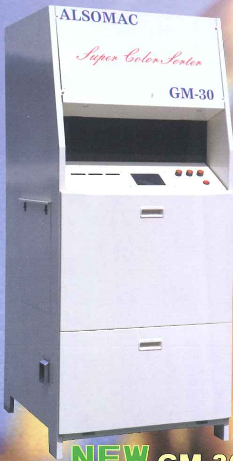
NEW GM 30